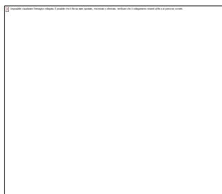
Figura 1.2. Tipologia per l'attribuzione di tratti fluviali ad un 'tipo' ai sensi della Direttiva 2000/60/CE, Sistema B. Diagramma di flusso per il Livello 2