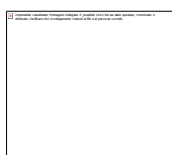
Fig.1.1 Rappresentazione delle idrocoregioni italiane con relativi codici numerici, denominazioni e confini regionali