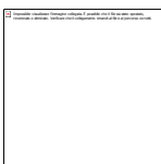
Figura 1.3. Tipologia per l'attribuzione di tratti fluviali ad un 'tipo'. Diagramma di flusso per il Livello 3

La metodologia qui proposta, che include un elevato numero di descrittori suggeriti dal sistema B della Direttiva 2000/60/CE, è stata basata, a tutti e tre i livelli, su fattori ritenuti importanti nello strutturare le biocenosi acquatiche e nel determinare il funzionamento degli ecosistemi fluviali. Peraltro, è ragionevole attendersi che l'effettiva risposta delle biocenosi possa non variare tra alcuni dei tipi identificati. La tipizzazione effettuata secondo il metodo della presente sezione deve essere successivamente validata attraverso verifiche a carattere biologico con l'obiettivo di definire i bio-tipi effettivamente presenti in ciascuna Idro-ecoregione. La verifica della presenza e dell'importanza dei diversi tipi (livello 2) nelle varie Idro-ecoregioni e Regioni è effettuata, ad opera di Regioni e Autorità di Bacino.