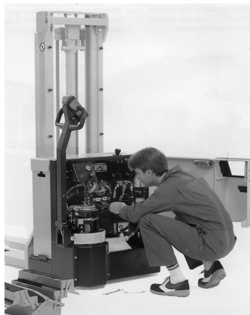
Figura 7: Anche i superiori gerarchici devono conoscere le regole della sicurezza nell'uso dei carrelli di movimentazione con timone.

Non è escluso che nella vostra azienda esistano altre fonti di pericolo sul tema della presente lista di controllo. In caso affermativo vogliate adottare le necessarie misure di sicurezza (vedere sul retro).