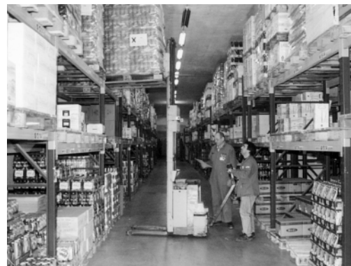
Figura 1: Ogni carrellista deve aver ricevuto una formazione comprendente: - le caratteristiche dell'apparecchio da utilizzare unitamente ai limiti d'uso quanto al carico da trasportare, al peso del carico, al centro di gravità, ecc.; - i rischi specifici dell'azienda (vedere domanda 3); - le tecniche di guida e di accatastamento; - le regole della circolazione interna; - il comportamento in caso di guasti e d'emergenza. Al carrellista può essere consegnato un permesso di condurre aziendale.