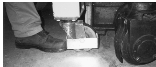
Figura 2: Il copriuota e le scarpe di sicurezza proteggono i piedi del carrellista.