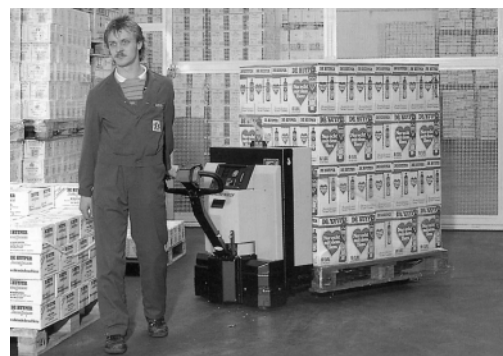
Figura 4: I carrelli di movimentazione provvisti di un timone lungo possono essere guidati con facilità e senza pericoli per i piedi del carrellista.