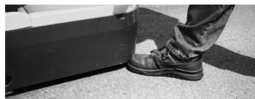
Figura 3: La piccola distanza fra il bordo del telaio e il pavimento (al massimo 35 mm) nonché l'uso delle scarpe di sicurezza offrono una protezione ottimale dei piedi del carrellista.