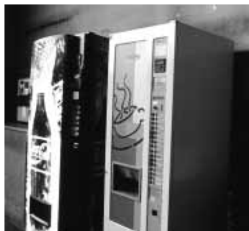
Bevande analcoliche calde e fredde in prossimità dei posti di lavoro.

Per ulteriori consigli e informazioni rivolgersi a: ISPA – Istituto svizzero di prevenzione dell'alcolismo e altre tossicomanie, Casella postale 870, 1001 Losanna, telefono 021-321 29 11