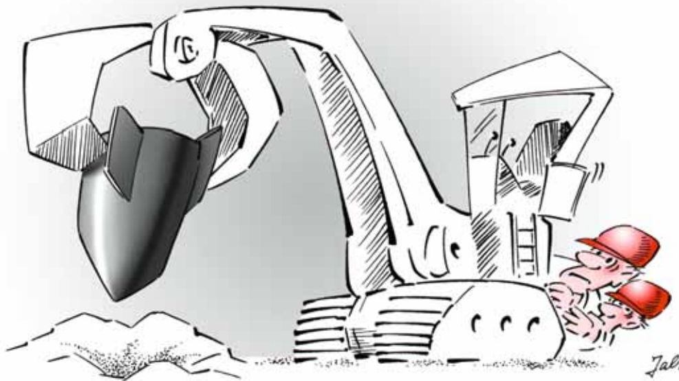
Figura 3 In caso di pericoli particolari rivolgetevi agli specialisti!