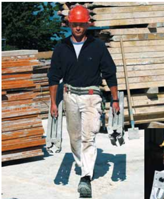
Figura 7 Se possibile, distribuire uniformemente il carico.

Anche quando si depone il carico la regola principale è piegare le gambe e tenere la schiena ben dritta.