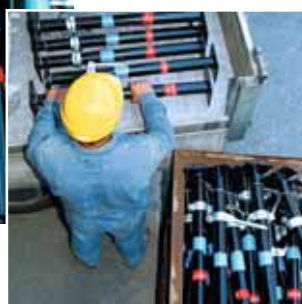
Figura 11 Quando spostate un peso da un lato all'altro, fate sempre un passo intermedio.