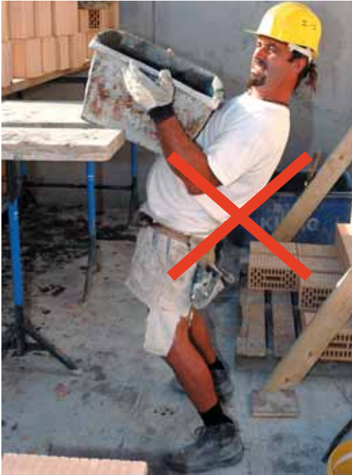
Figura 9 Evitare di inarcare la regione lombare. Questo succede quando si pretende troppo dalle proprie forze.