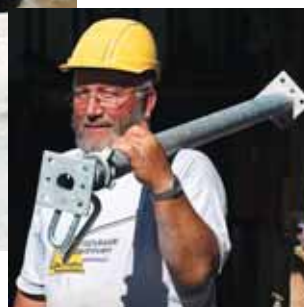
Figura 8 Il modo migliore per trasportare i puntelli o i sacchi è appoggiarli sulle spalle, tenendo la schiena ben dritta!

In caso di domande su questo argomento consigliamo di contattare l'addetto alla sicurezza.