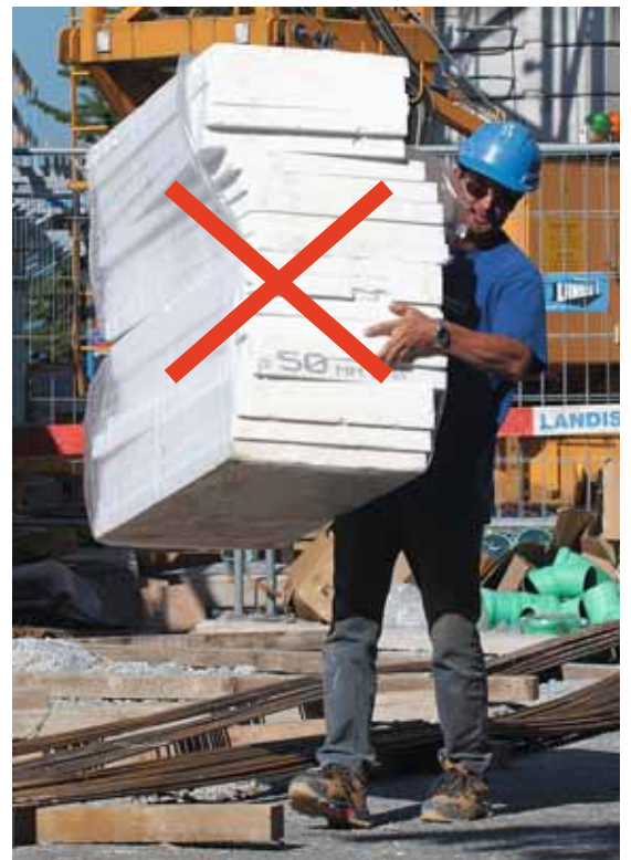
Figura 12 Spesso i pacchi vengono accatastati uno sopra l'altro, bloccando in questo modo la visuale. Attenzione, poiché camminare alla cieca su e giù per le scale può diventare molto pericoloso. Quindi, fate in modo di avere sempre la visuale libera!