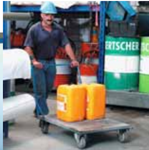
Figura 14 ... o a quattro ruote.

Se non conoscete l'effettivo peso di un carico, è bene iniziare l'azione di sollevamento facendo un timido tentativo, ma con molta attenzione. Cercate di mantenere la corretta posizione del corpo (figura 5).