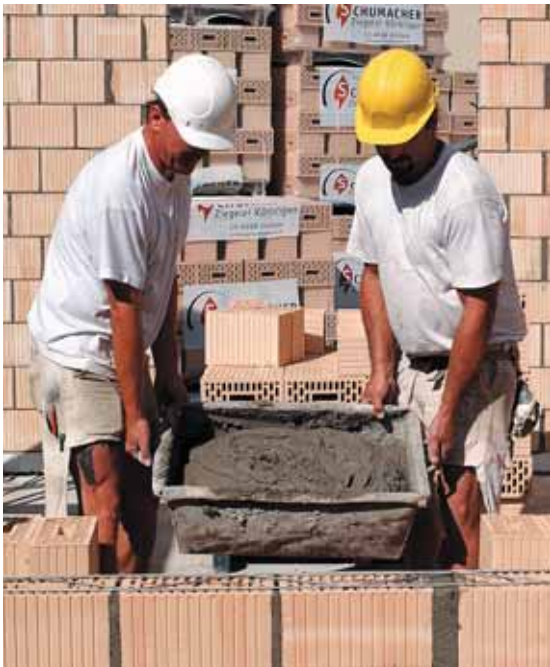
Figura 15 In due va molto meglio.