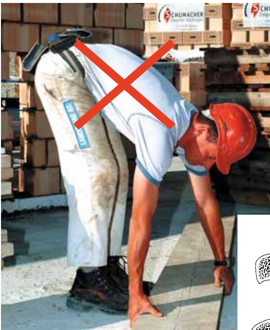
Figura 3 Sollevamento di un carico con la schiena curvata (tecnica scorretta).

Se si solleva un carico inarcando la schiena (tecnica scorretta) i dischi intervertebrali vengono deformati e compressi maggiormente sulla parte anteriore che posteriore. Quanto più forte è l'inclinazione del tronco in avanti e pesante il carico, tanto maggiore risulta il carico a danno dei dischi intervertebrali, con conseguenti traumi o lesioni alla schiena.