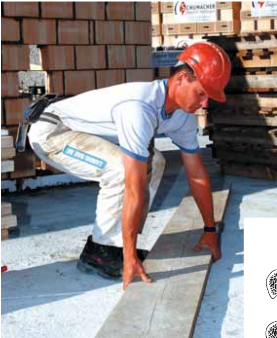
Figura 1 Se la tecnica di sollevamento è corretta la schiena deve essere diritta.