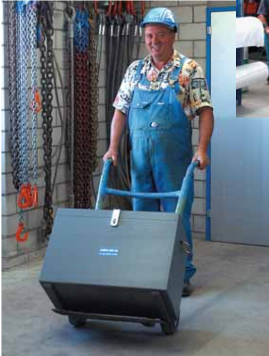
Figura 13 Utilizzate mezzi ausiliari, ad es. un carrello a due ruote ...