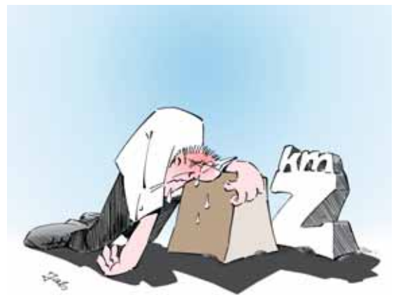
Figura 16 Anche i pesi più leggeri possono diventare faticosi se si devono percorrere tragitti molto lunghi. Pertanto, se il percorso è lungo, è consigliabile ripartire il peso. Ad esempio, se dobbiamo spostare un carico per 20 m, prendiamo solo la metà di quello che avremmo trasportato su una distanza di 2 m. Se il peso non si può ripartire, è bene utilizzare un mezzo di trasporto.