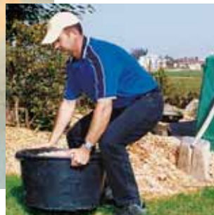
Figura 6 ... così come nel tempo libero.