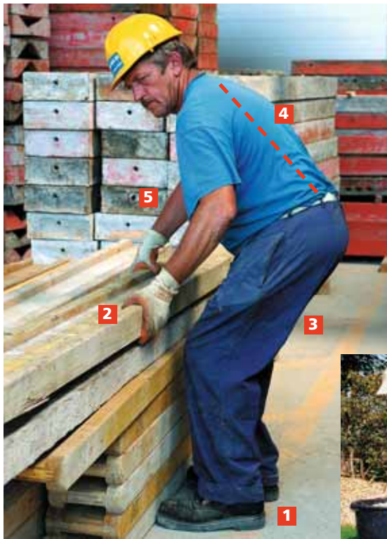
Figura 5 Sollevare i carichi nel modo corretto. Questo vale sul posto di lavoro ...