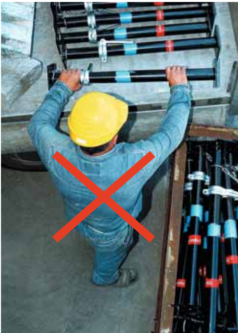
Figura 10 Quando si solleva e si depone un carico bisogna evitare assolutamente la torsione del busto.